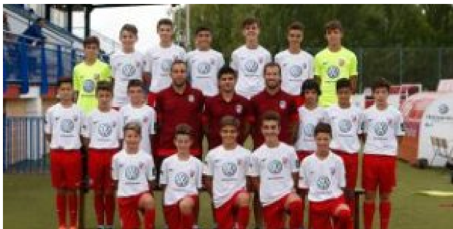
El Santa Marta 'salva' a la Cultural