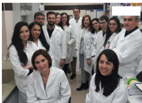
El grupo de investigadores de la USAL/IBSAL que localizaron esta alteración.

J.H.D. Un grupo de investigación de la Universidad de Salamanca-IBSAL ha localizado una variación genética que multiplica el riesgo de sufrir accidentes cardiovasculares en pacientes que ya tienen hipertensión o diabetes . Es un hallazgo que va a reforzar el trabajo de la Medicina Preventiva y que, traducido a dinero, puede ayudar a reducir considerablemente el gasto sanitario.