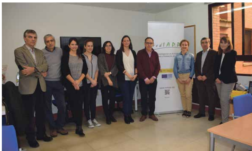
Equipo investigador del Centro de Salud La Alamedilla

A mí me gustaría seguir trabajando siempre en este ámbito, pues también te permite el trato directo con la persona, con el paciente.